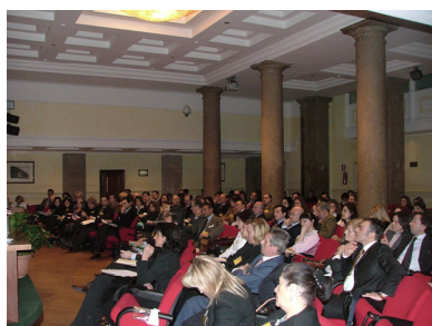
Camera dei Deputati - Roma Palazzo Marini Convegno Incidenti Stradali