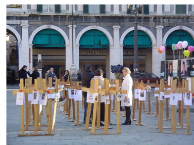
Iniziativa Sede di Brescia