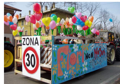
Iniziativa Sede di Modena

In collaborazione con La Provincia ed il Comune di Roma, il M.I.U.R. Ministero Istruzione Università e Ricerca - C.S.A. di Roma, siamo riusciti a realizzare tre cortometraggi aventi per tema “AIUTATECI a FRENARE LA STRAGE STRADALE” nell'ambito del progetto “I CORTI DI MAURI” che ha coinvolto migliaia di studenti di Roma e Provincia. Detta iniziativa ha avuto il suo epilogo con la presentazione dei corti realizzati presso la prestigiosa sede dell'AUDITORIUM PARCO della MUSICA in Roma. L'innovazione dell'iniziativa (per la prima volta GIOVANI che parlano ai GIOVANI) è stata colta dalla PROVINCIA di ROMA che ha prodotto 1000 DVD contenenti i suddetti cortometraggi. Detti DVD saranno diffusi nelle scuole per stimolare dibattiti sul tema della SICUREZZA STRADALE. Come sede di Roma siamo stati ospiti di TV e radio locali e nazionali (SAT 2000, RAI TRE, ISORADIO).