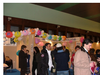
Iniziativa Sede di Roma